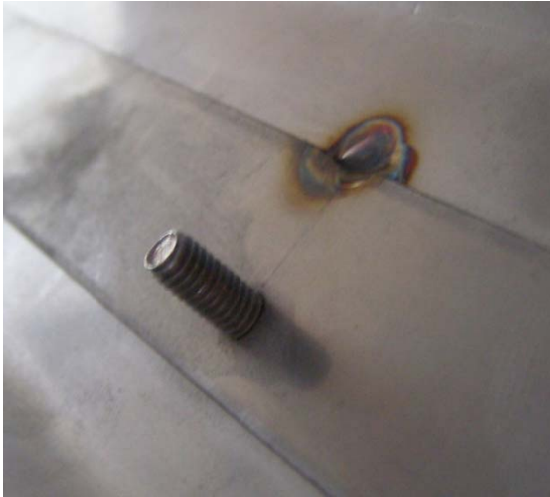
Figur 2. Hopfogning på insidan av oktagontorn, enligt nuvarande metod.