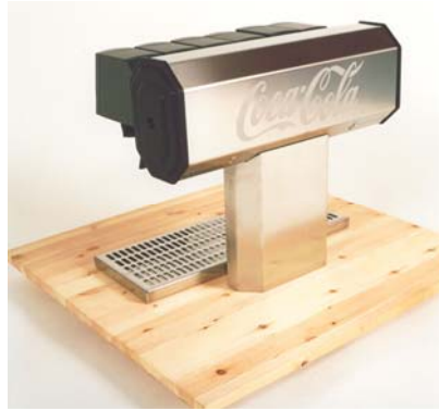
Figur 1. Oktagontorn för servering av läsk.